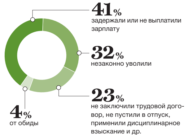
РИСУНОК 1 ИЗ-ЗА ЧЕГО РАБОТНИКИ ЖАЛУЮТСЯ В РОСТРУД?

Правило 2. Потребовать объяснений у провинившегося работника. До применения дисциплинарного взыскания надо затребовать у работника письменное объяснение (ст. 193 ТК РФ). Требование нужно составить в письменной форме, а не устно или по телефону. Если по истечении двух дней работник не предоставит объяснение, то составляется соответствующий акт об отказе. Только после этого работника